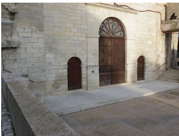
Le repère est au centre de la photo

Liste des repères du triplet : F'.DF - 5 , F'.DF - 6 , F'.DF - 7 BIS , F'.DF - 8 , F'.DF - 9 , F'.D.O3 - 20 BIS , F'.F.K3 - 144 , F'.F.K3 - 145