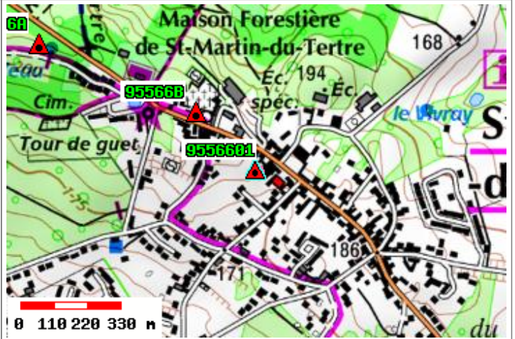
Carte : 2313 ISLE-ADAM (L')