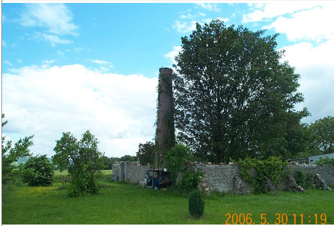
Azimut de la prise de vue : 220 gr

No du Site 9514101 Site du Réseau de détail