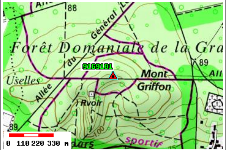
Carte : 2315 CORBEIL-ESSONNES