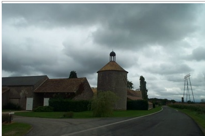
Azimut de la prise de vue : 155 gr