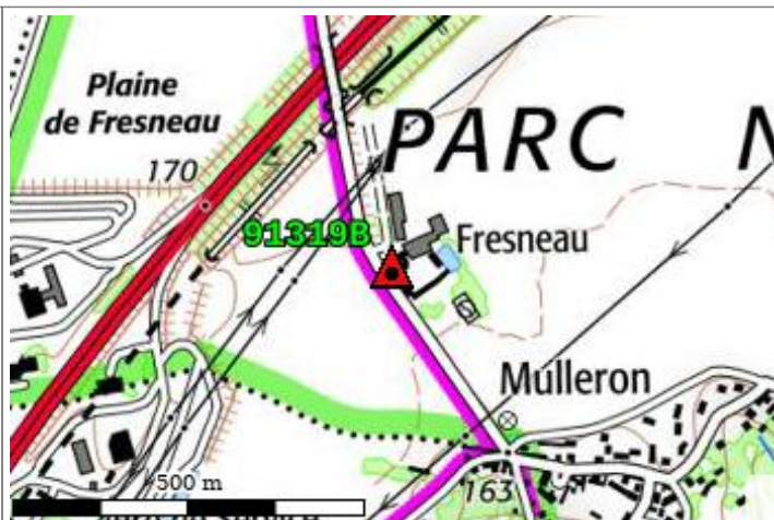
Carte : 2215 RAMBOUILLET