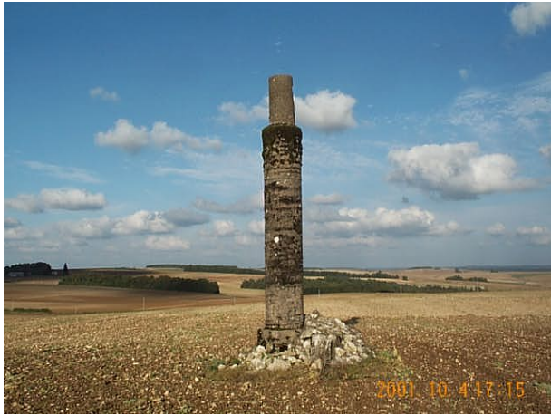
Azimut de la prise de vue : 55 gr

No du Site 8901901 Site du Réseau de détail