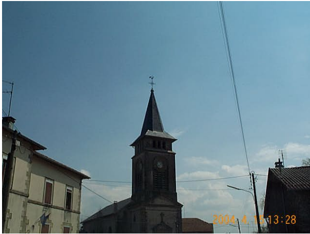
Azimut de la prise de vue : 135 gr