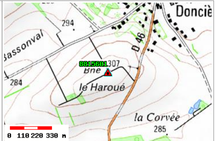
Carte : 3517 RAMBERVILLERS