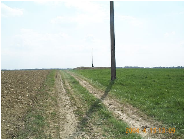
Azimut de la prise de vue : 179 gr