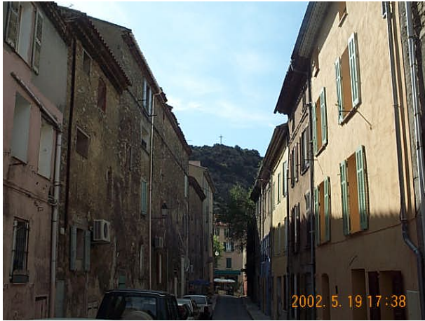
Azimut de la prise de vue : 310 gr