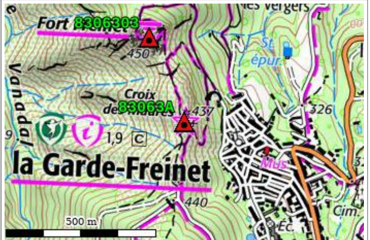
Carte : 3445 COLLOBRIERES