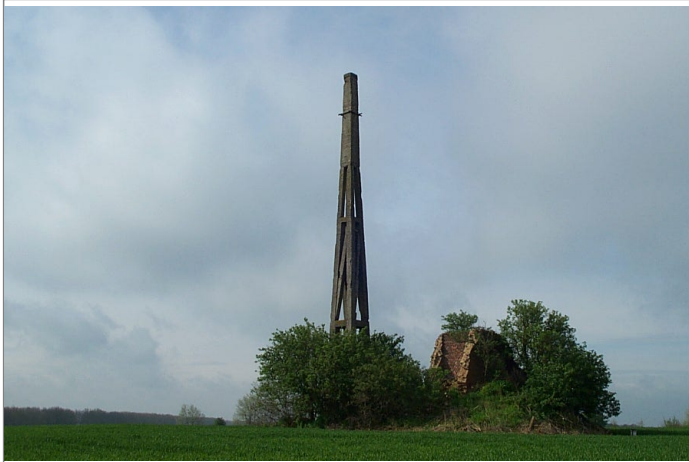
Azimut de la prise de vue : 220 gr