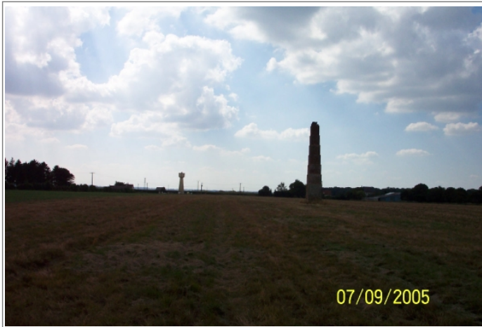
Azimut de la prise de vue : 255 gr