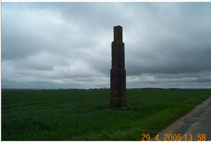
Azimut de la prise de vue : 140 gr