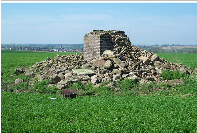
Azimut de la prise de vue : 270 gr