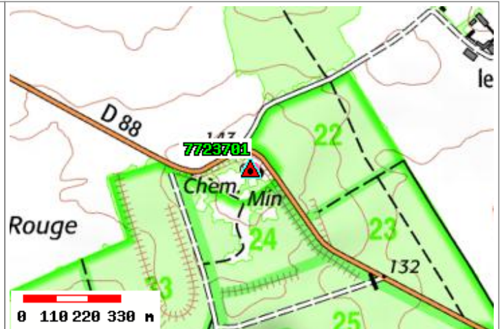
Carte : 2414 LAGNY