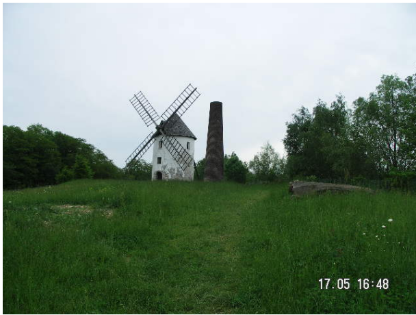
Azimut de la prise de vue : 145 gr