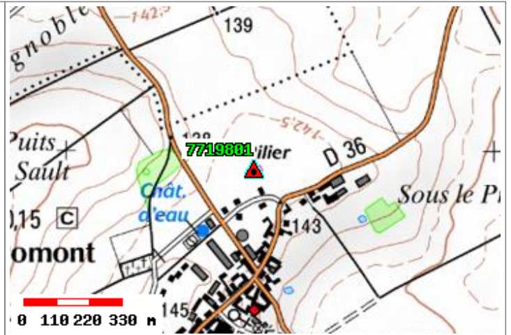
Carte : 2317 MALESHERBES