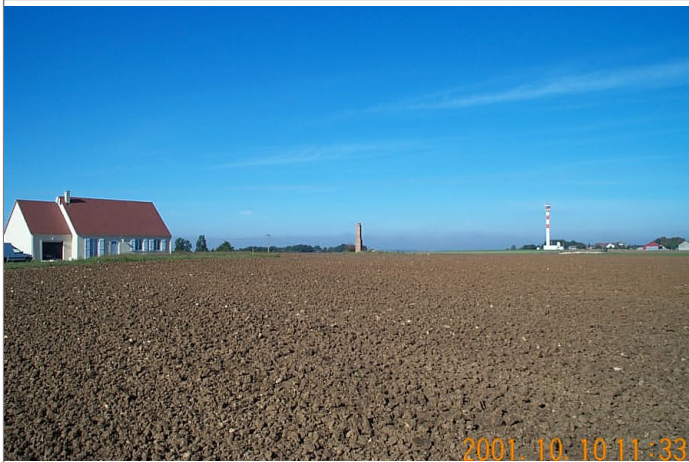
Azimut de la prise de vue : 330 gr