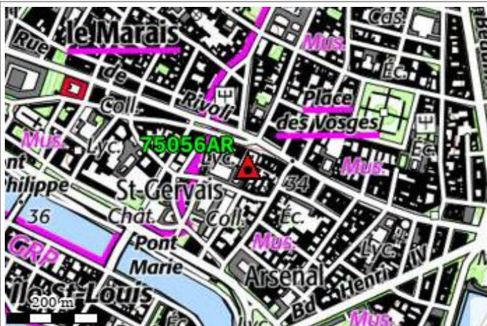
Carte : 2314 PARIS