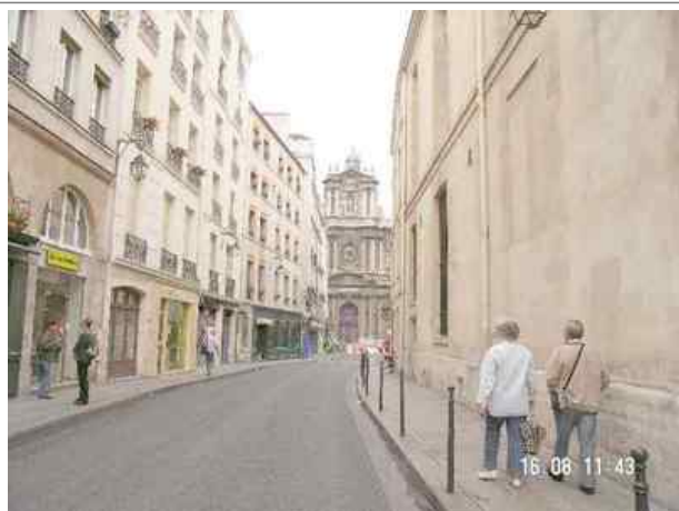
Azimut de la prise de vue : 220 gr