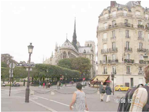
Azimut de la prise de vue : 325 gr