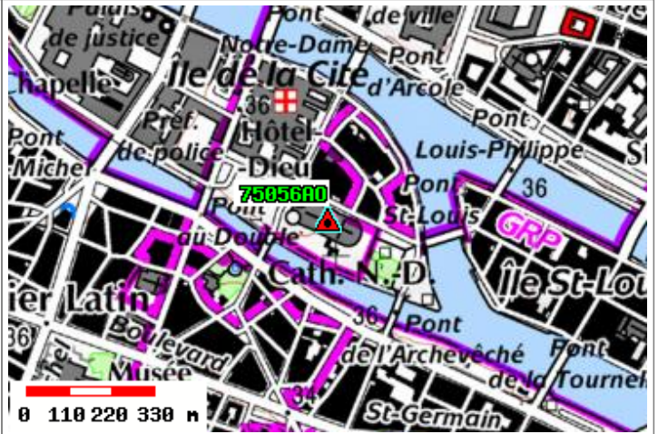
Carte : 2314 PARIS