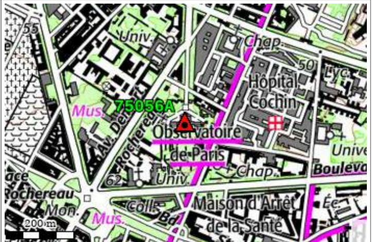
Carte : 2314 PARIS