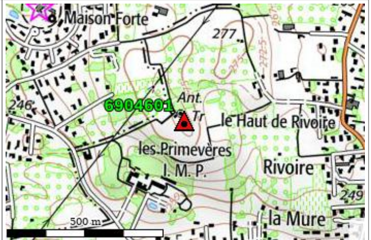
Carte : 3032 GIVORS