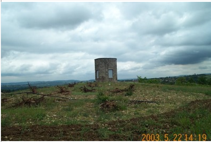
Azimut de la prise de vue : 170 gr