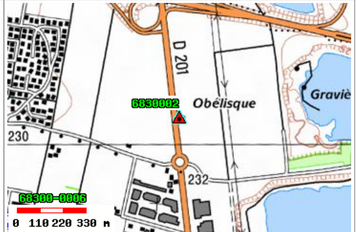
Carte : 3720 MULHOUSE