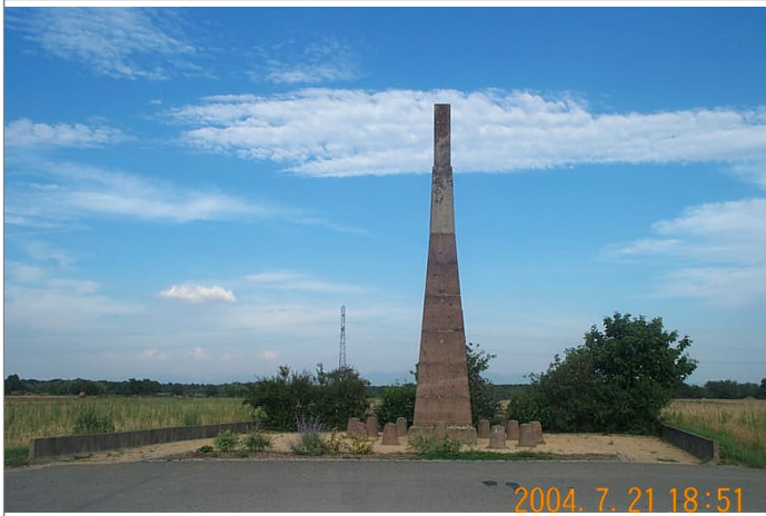
Azimut de la prise de vue : 90 gr