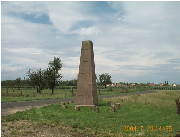
Azimut de la prise de vue : 390 gr

Lieu-dit : TERME NORD DE LA BASE D'OBERHERGHEIM Site du Réseau de détail