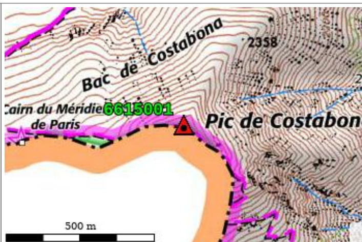
Carte : 2350 PRATS-DE-MOLLO-LA-PRESTE