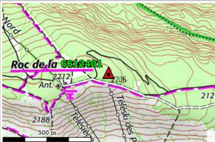
Carte : 2249 MONT-LOUIS