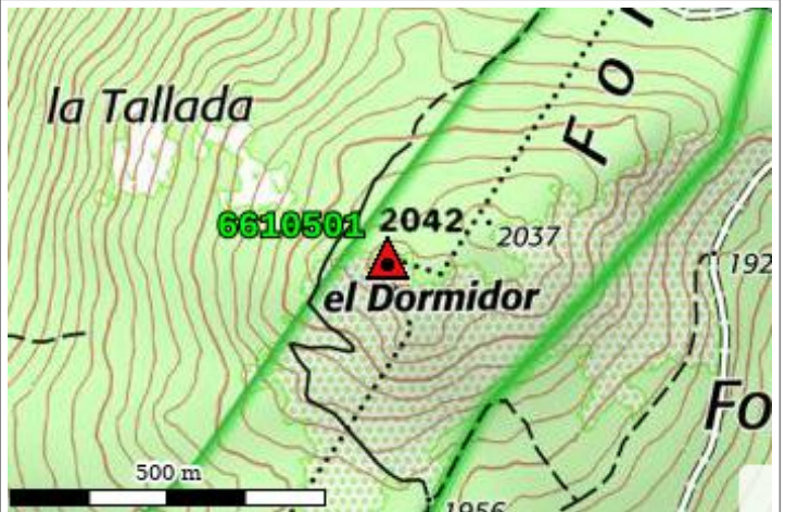
Carte : 2249 MONT-LOUIS