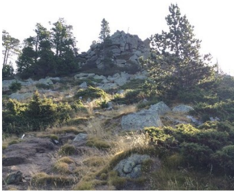
Azimut de la prise de vue : 111 gr