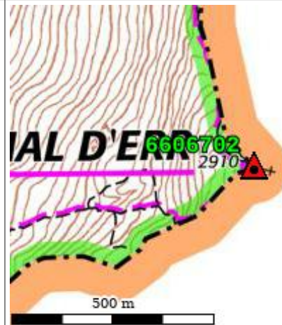
Carte : 2250 SAILLAGOUSE

Borne à 9km.4 - S.E. d'ERR. Prendre au S.E. d'ERR le chemin qui traverse la rivière d'ERR et mène vers la Jasse de LAS PLANES. Remonter l'ERR jusqu'à la cascade (100m. en aval de la source). Remonter alors le thalweg vers le Sud, arrivé dans les éboulis obliquer vers l'Est et monter directement au sommet où est implantée la borne. (D'ERR au sommet : 3 heures de marche).