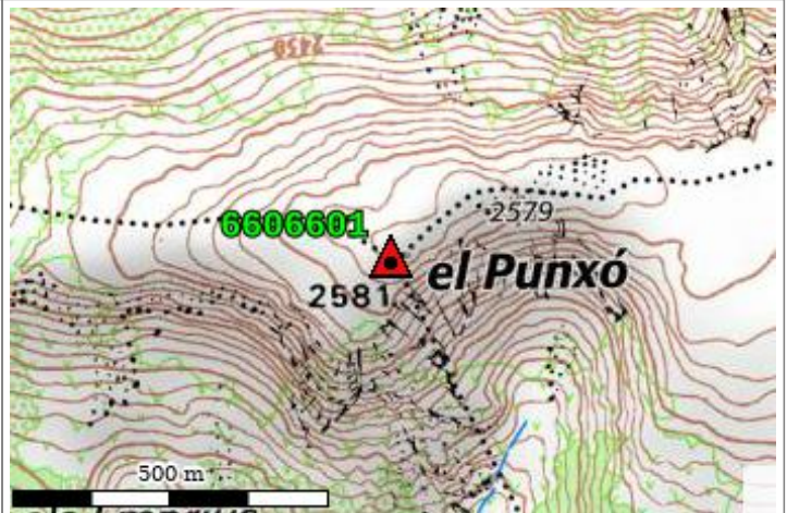
Carte : 2249 MONT-LOUIS