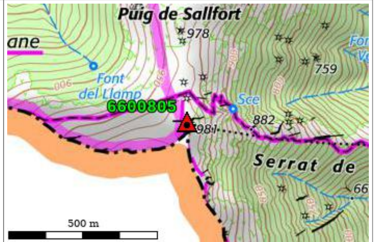
Carte : 2550 CERBERE

Borne à 8km.3 – S.S.E. d'ARGELÈS-sur-MER.