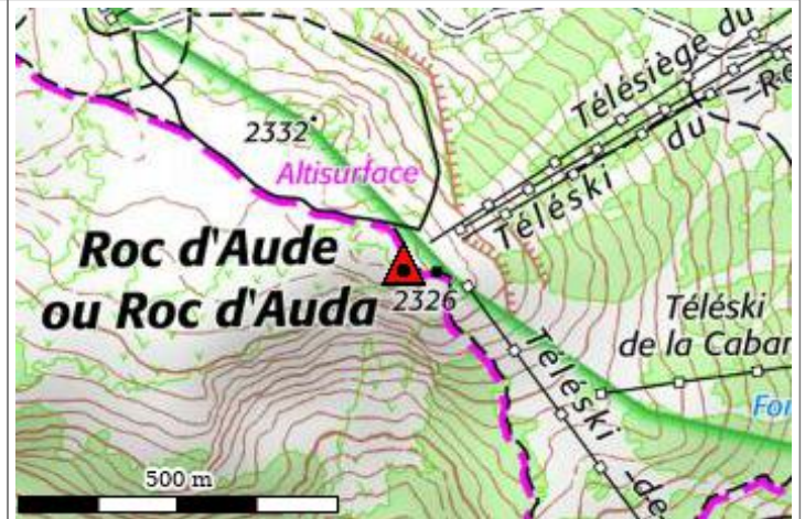
Carte : 2249 MONT-LOUIS