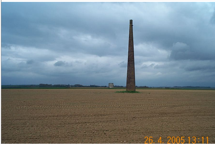
Azimut de la prise de vue : 372 gr