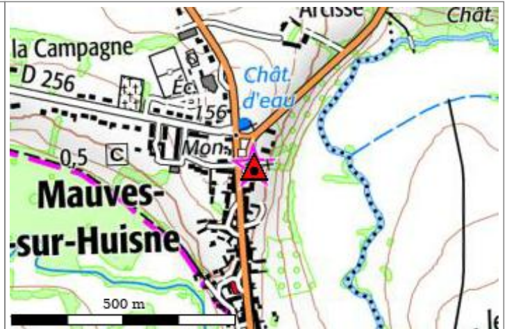
Carte : 1816 MORTAGNE-AU-PERCHE