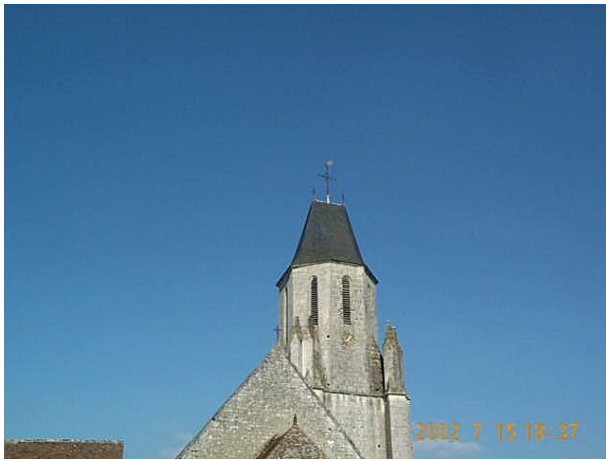
Azimut de la prise de vue : 105 gr