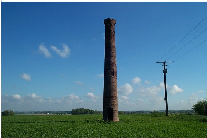
Azimut de la prise de vue : 10 gr