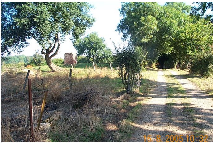
Azimut de la prise de vue : 382 gr