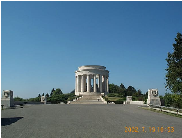
Azimut de la prise de vue : 242 gr

No du Site 5535302 Site du Réseau de détail