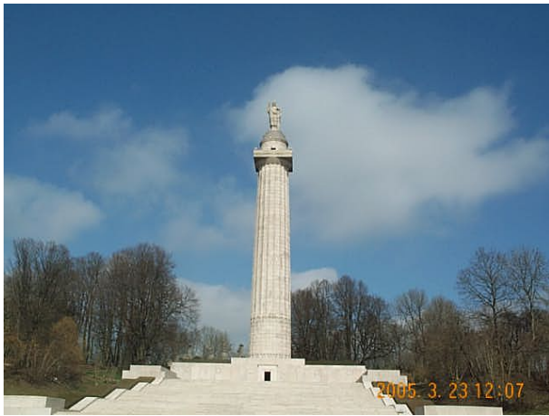
Azimut de la prise de vue : 389 gr