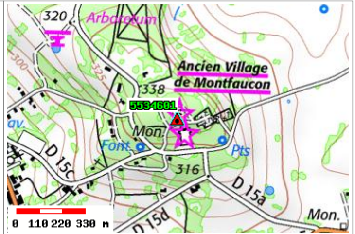
Carte : 3112 VERDUN