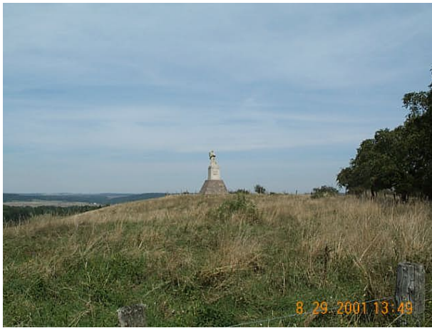
Azimut de la prise de vue : 18 gr

No du Site 5458801 Site du Réseau de détail