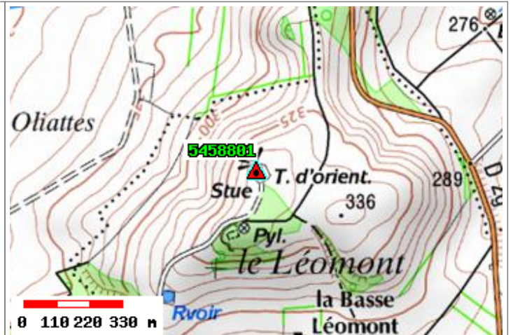
Carte : 3415 NANCY