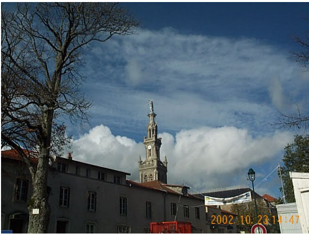
Azimut de la prise de vue : 384 gr