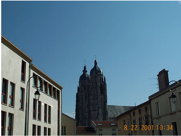
Azimut de la prise de vue : 70 gr