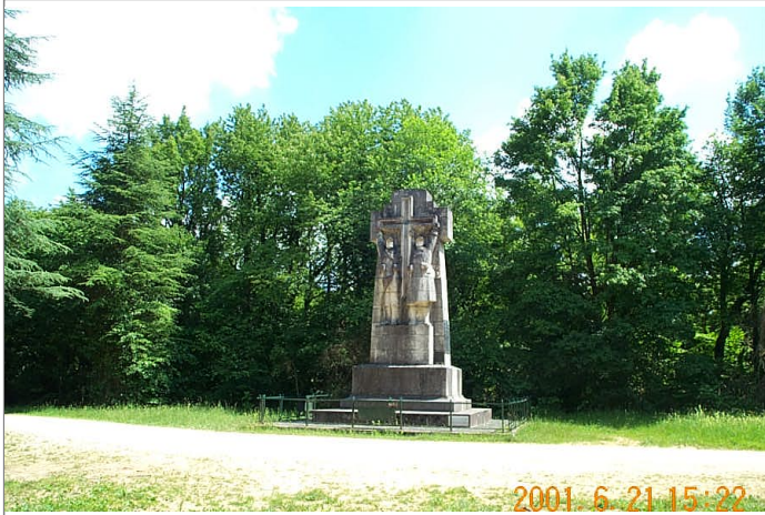
Azimut de la prise de vue : 157 gr