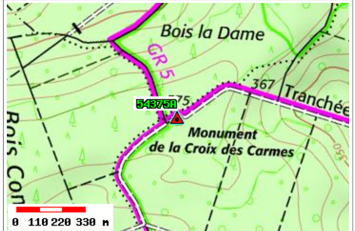
Carte : 3314 PONT-A-MOUSSON