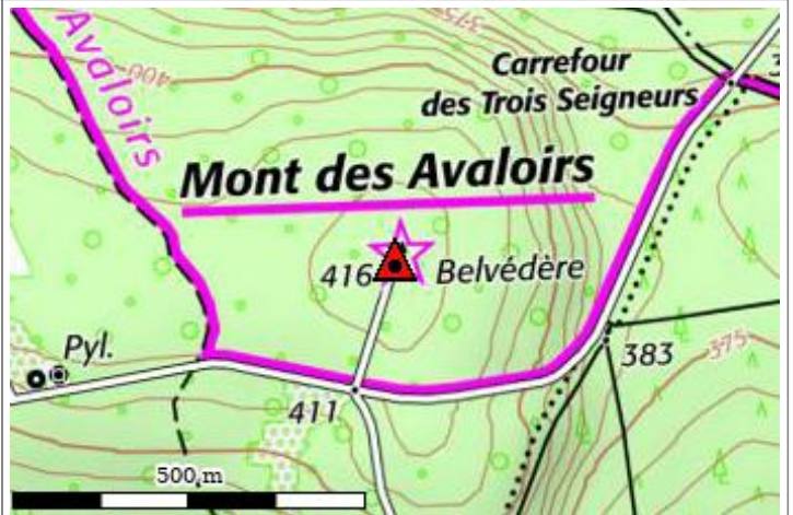
Carte : 1616 FERTE-MACE (LA)