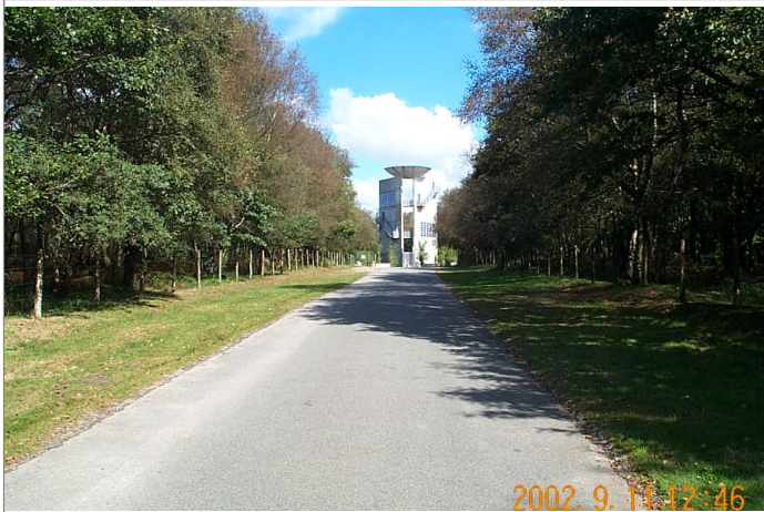
Azimut de la prise de vue : 30 gr