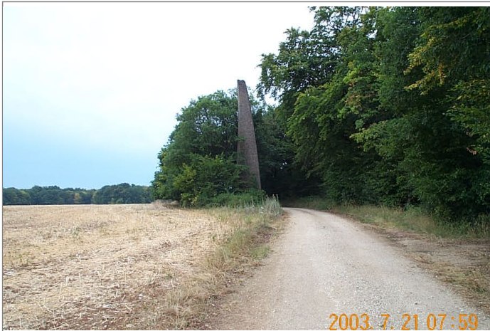
Azimut de la prise de vue : 190 gr