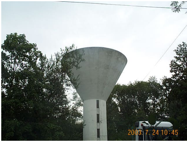
Azimut de la prise de vue : 80 gr

No du Site 5230202 Site du Réseau de détail