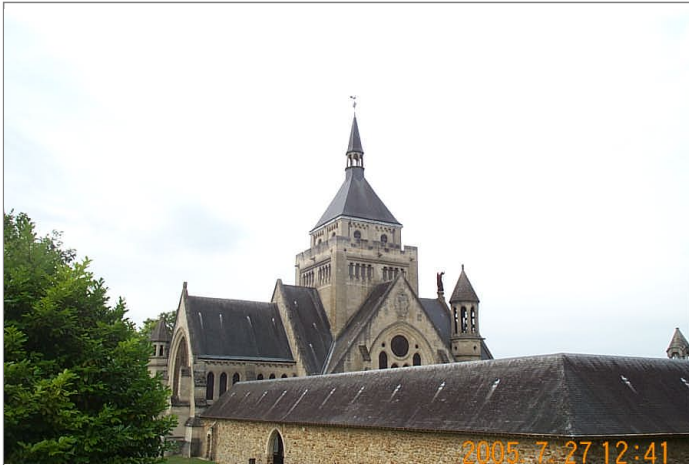
Azimut de la prise de vue : 250 gr