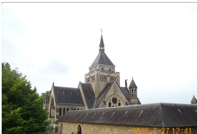
Azimut de la prise de vue : 250 gr