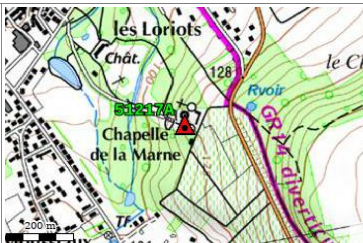
Carte : 2713 EPERNAY