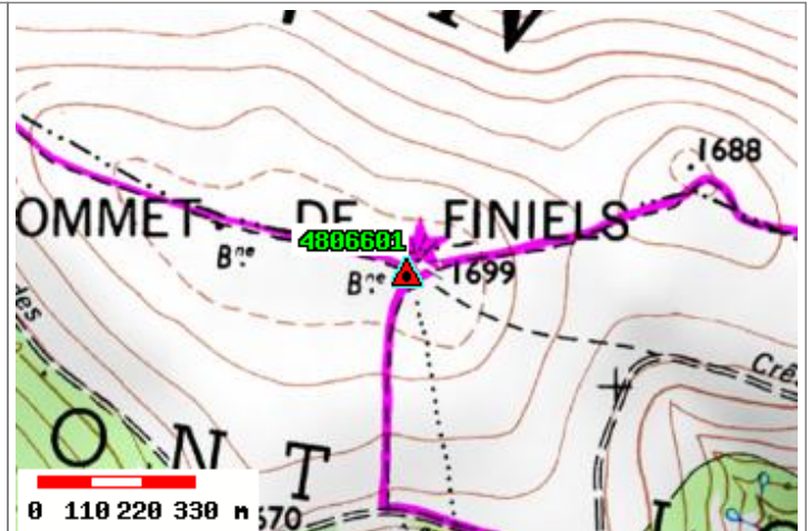
Carte : 2739 GENOLHAC