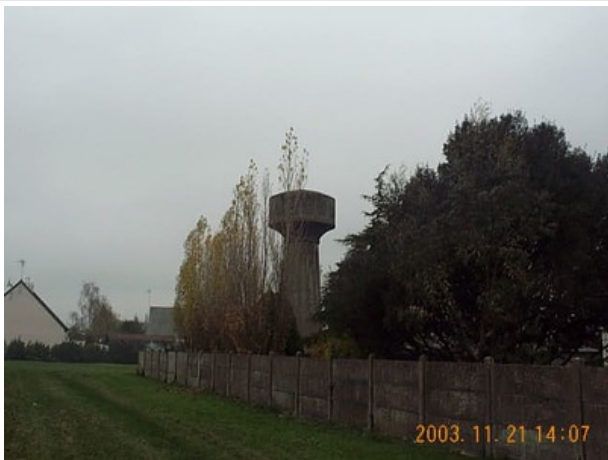
Azimut de la prise de vue : 0 gr