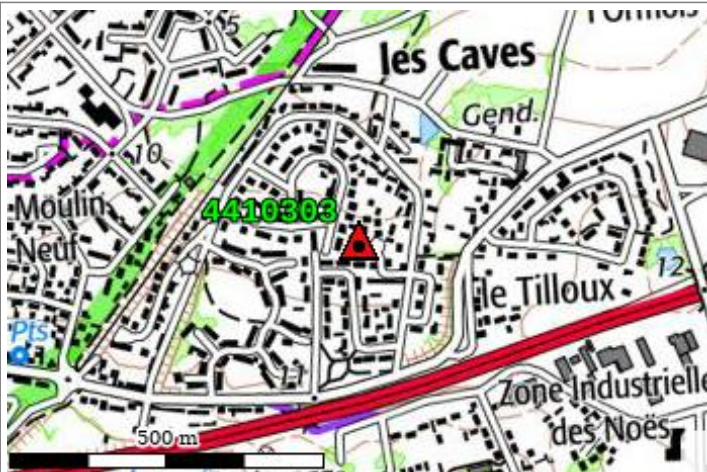
Carte : 1123 PAIMBOEUF