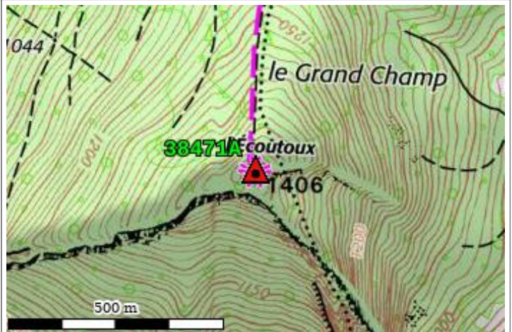
Carte : 3334 DOMENE

Borne à 1km.8 - S.O. de SAPPEY-en-CHARTREUSE. Depuis SAPPEY-en-CHARTREUSE, atteindre le hameau des SAGNES. Laisser la jeep à 300m. - Sud du hameau. Emprunter le sentier suivant la crête au Sud. Arrivé à un col, monter à travers les arbres jusqu'au sommet. (1 heure 15 minutes de marche depuis le hameau des SAGNES).