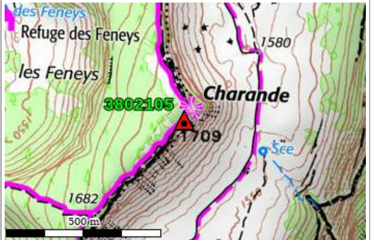
Carte : 3234 GRENOBLE