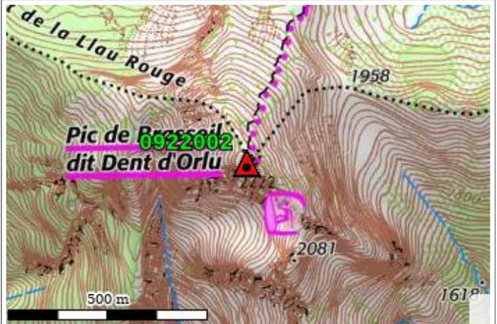
Carte : 2248 AX-LES-THERMES