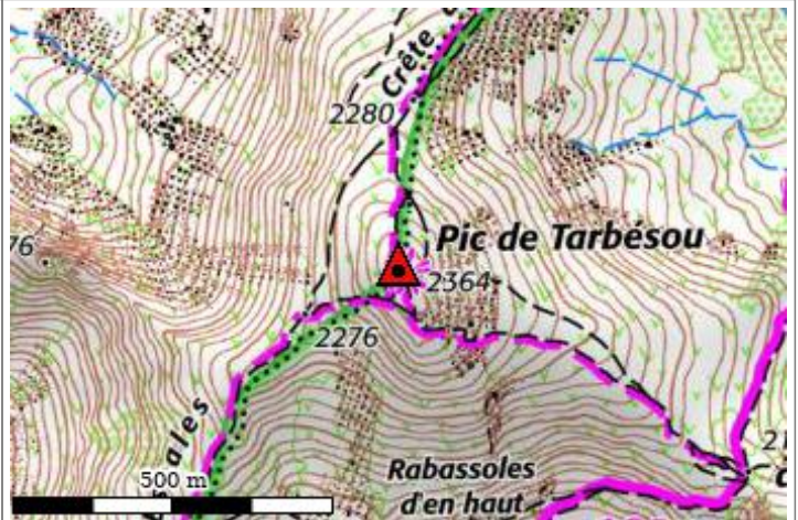
Carte : 2248 AX-LES-THERMES