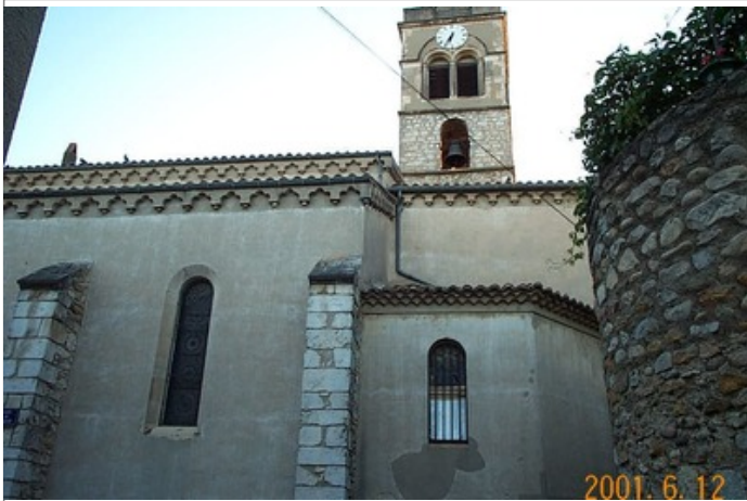
Azimut de la prise de vue : 45 gr