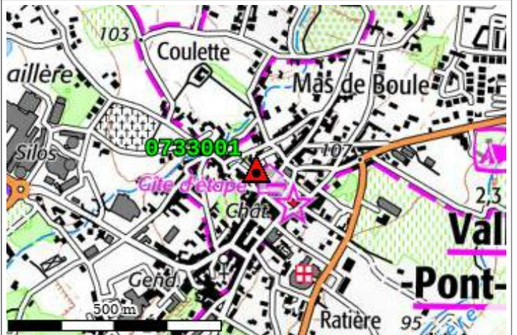
Carte : 2939 BOURG-SAINT-ANDEOL