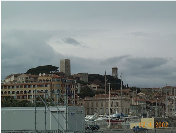
Azimut de la prise de vue : 352 gr