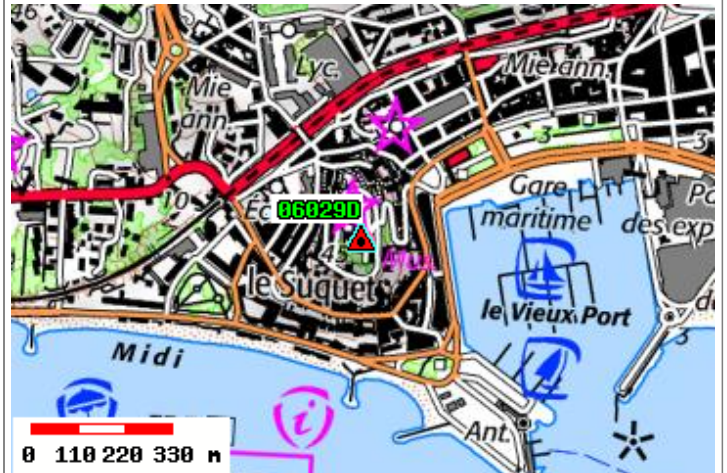
Carte : 3644 CANNES