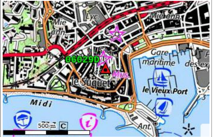
Carte : 3644 CANNES