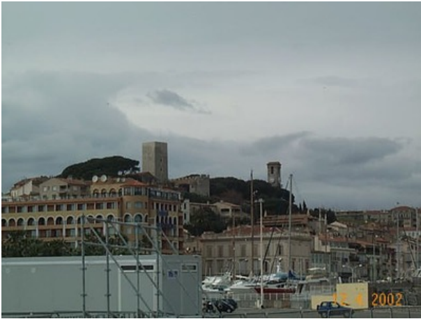
Azimut de la prise de vue : 352 gr